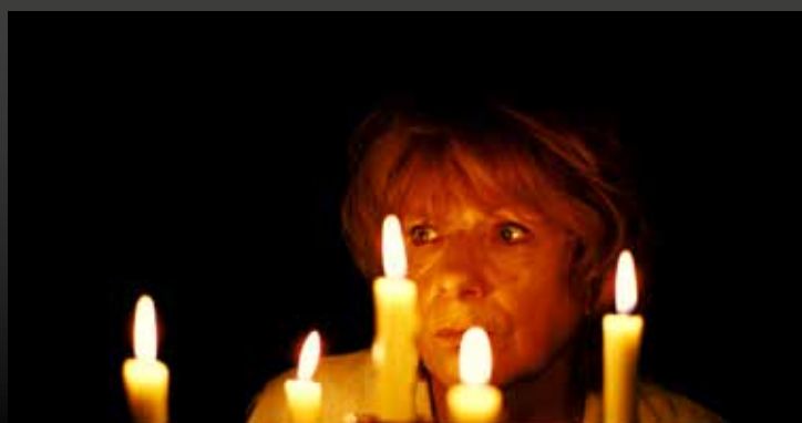
Filmstill zu „Sanfte Schminke des Lichts“, 2007