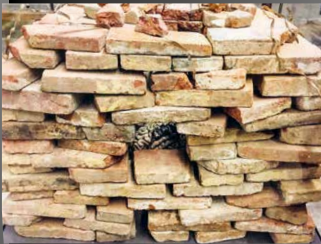
Anselm Kiefer, Hirnhäuslein, Vitrine, 2018 Courtesy Alexander Kluge

Wie in einer neuzeitlichen WUNDERKAMMER werden NEUGIER und STAUNEN geweckt, wenn KUNST , WISSENSCHAFT und MUSIK zueinander finden. Mit archäologischem Gespür untersucht Alexander Kluge die emotionalen und sozial-psychologischen Möglichkeiten der Oper als berührender und bewegender Wellengang in einer von Rationalität und Kalkül geprägten Zeit. DEN ALGORITHMEN UNSERER ZEIT FEHLT DAS GEFÜHL. DAS THEMENREPERTOIRE DER OPER HINGEGEN SCHÖPFT AUS DER SEELISCHEN ERREGUNG UND FINDET SEINEN AUSDRUCK IN DER ERGREIFENDEN MACHT DER MUSIK - mal FEURIG , mal EXZENTRISCH , mal LEIDENSCHAFTLICH , mal von TRAURIGKEIT und MELANCHOLIE geprägt.