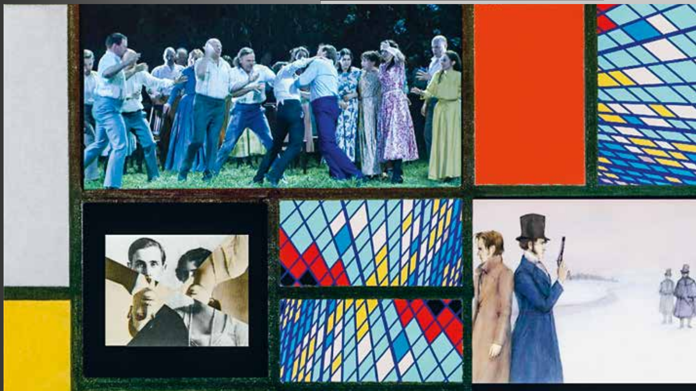
Mondrianmaschine Nr.3 „Puschkin's Lost Diary“ Courtesy Alexander Kluge / Sarah Morris