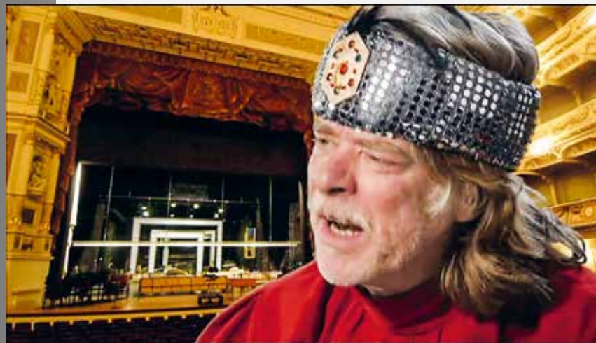
Filmstill zu „Tempel der Ernsthaftigkeit“, 2019